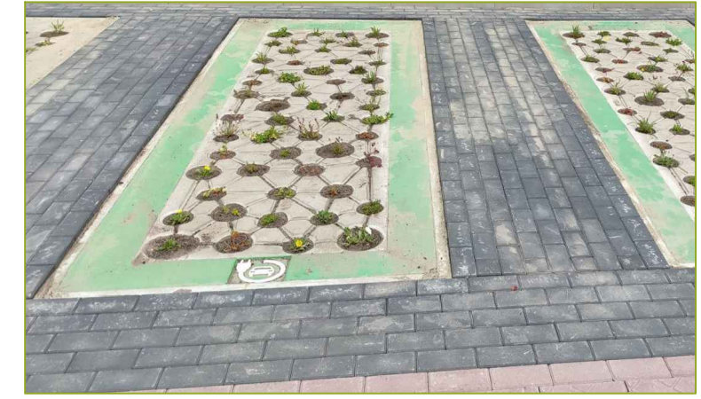
Betonplaat met ondergrondse berging