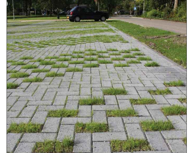
Deels open bestrating ±10%-30% groen