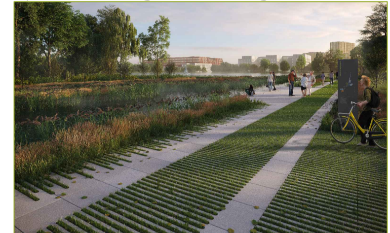
Open bestrating ±10%-50% groen