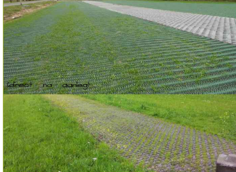
Graslandversteving ±100% groen