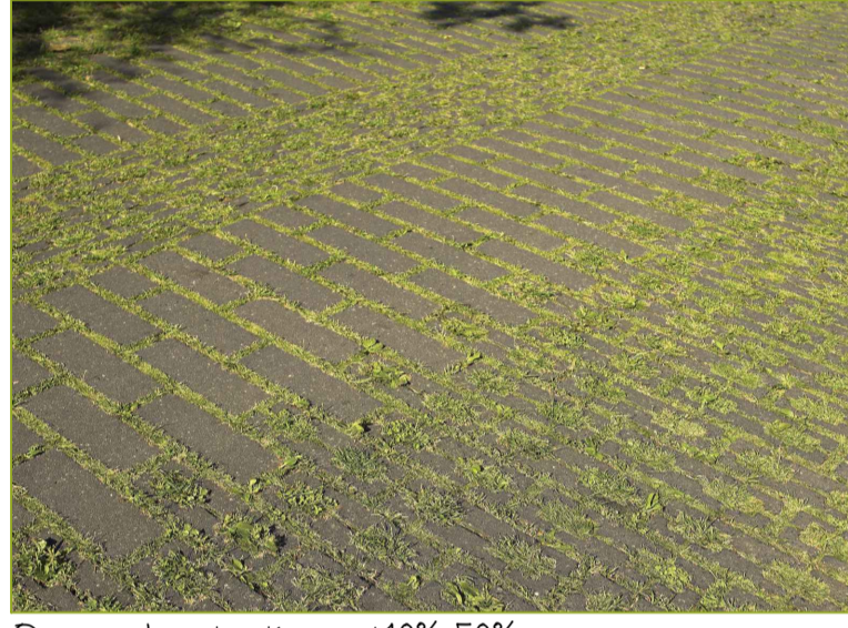
Open bestrating ±10%-50% groen