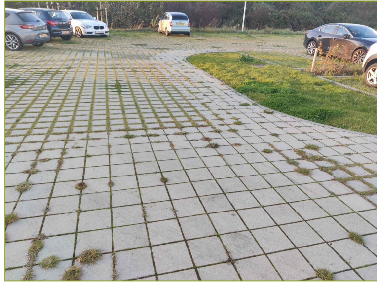
Deels open bestrating ±10%-20% groen