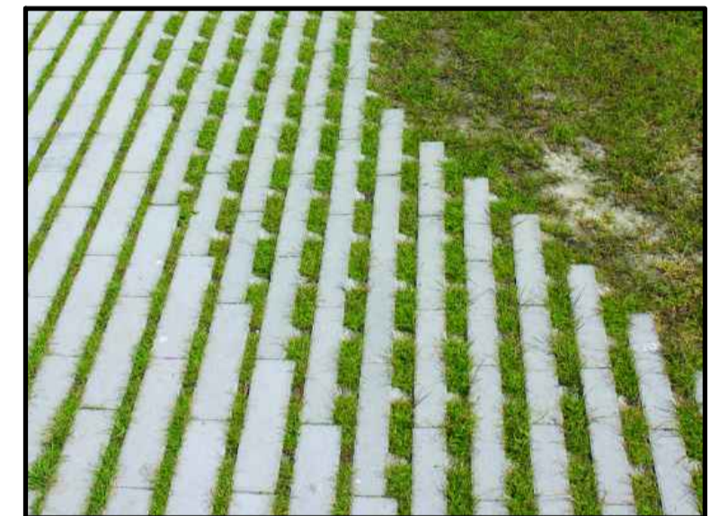
Open bestrating ±10%-50% groen