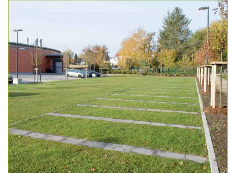
Kunststof grasplaten ±100% groen