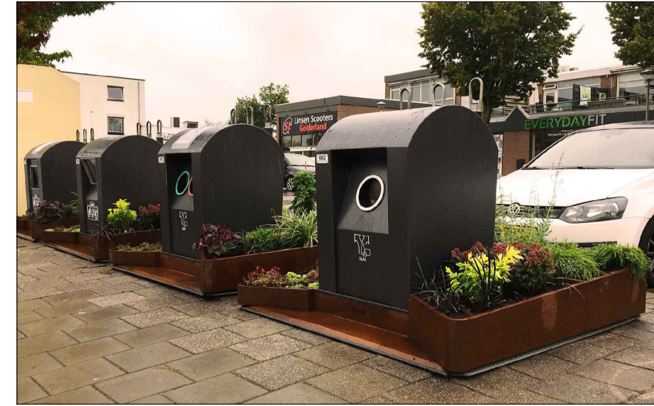
Slimme afvalcontainers met sensoren die zien of de container vol is. Aankleding rond de containers om zwerfafval te voorkomen