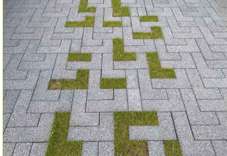
Deels open bestrating ±10%-30% groen