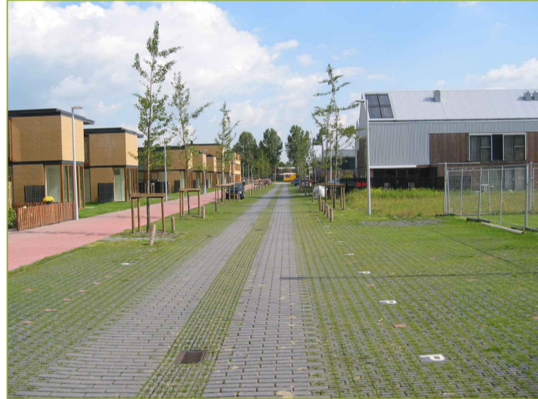
Open bestrating ±10%-50% groen