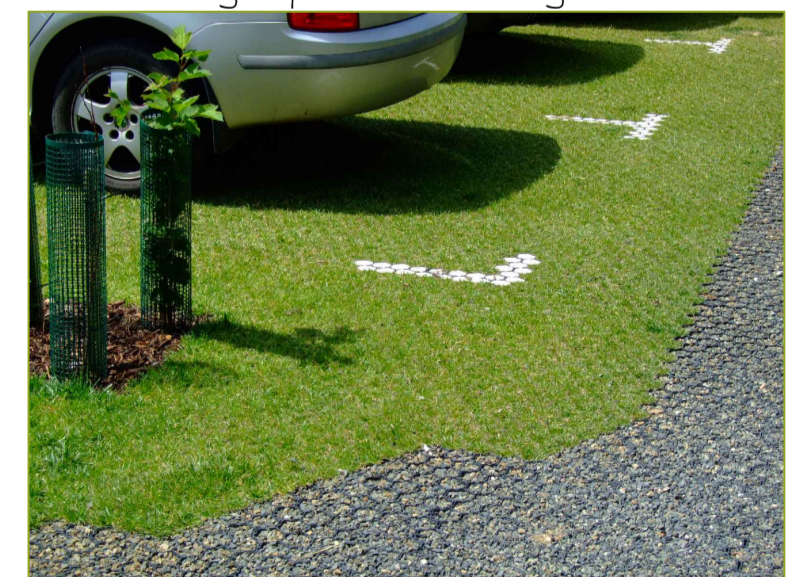
Kunststof grasplaten met markering