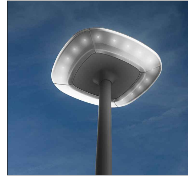
Slimme lichtmasten met sensoren: • geluidsdetectie • aanwezigheidsdetectie • camera