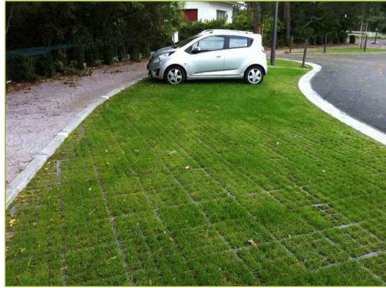
Kunststof grasplaten ±100% groen