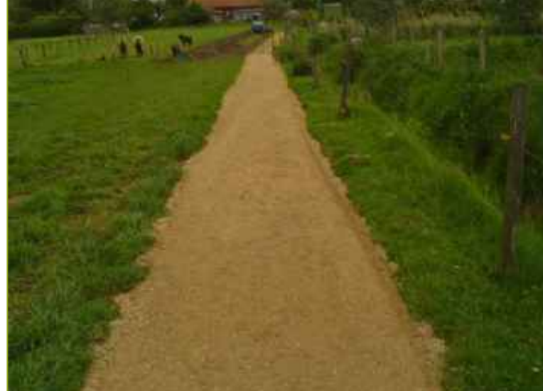
Gebonden halfverharding wandelpaden