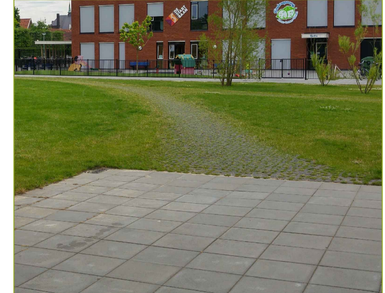
Pad van graskeien ±30% groen