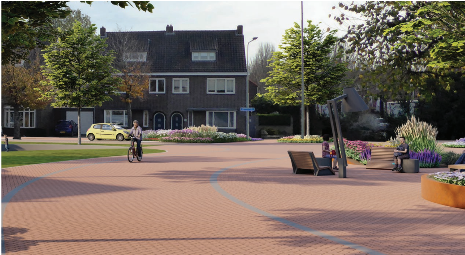
Streetview 'huiskamer' Carmelietenstraat