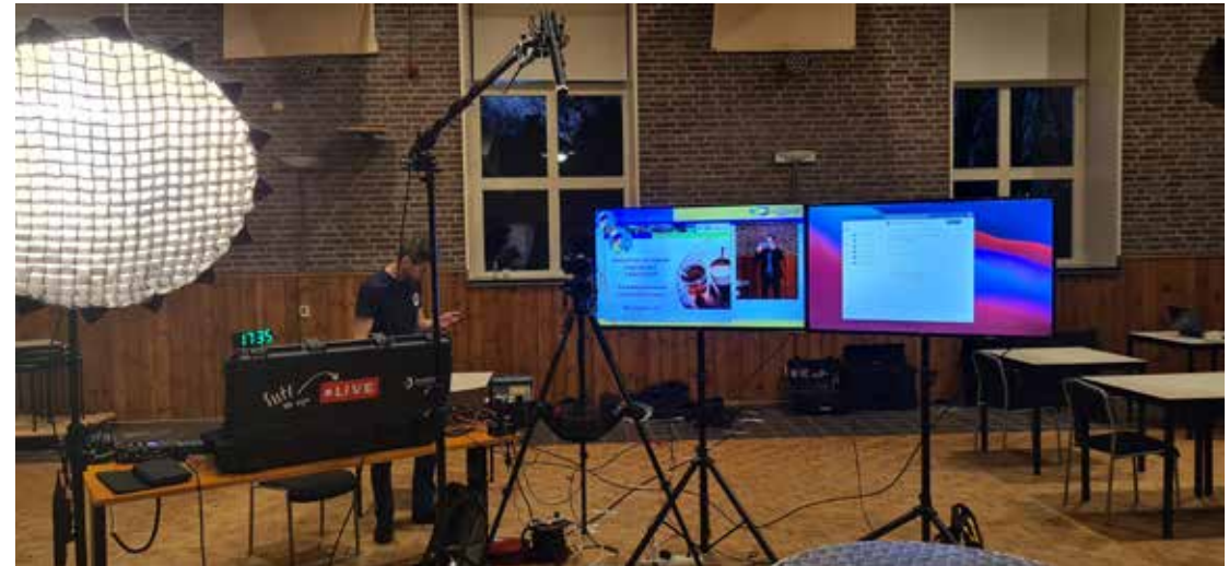
Mobiele studio t.b.v. de digitale beginspraakavond op 18 januari j.l.